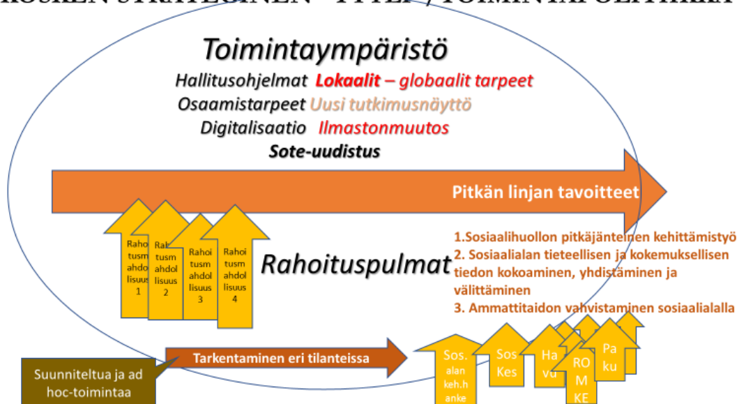
Kuva 1. Kosken toimintapolitiikka