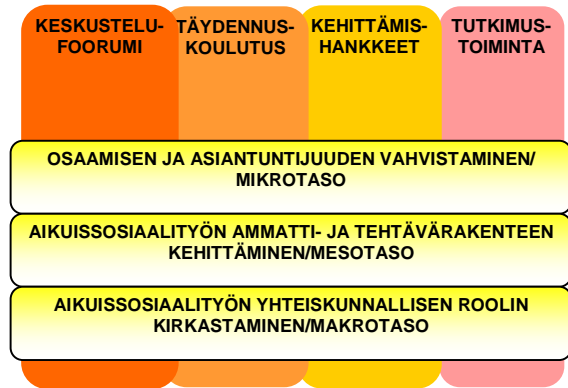
Kuvio 1. Hankkeet tavoitteet, tasot ja keinot

Kuvio 1 jäsentää aikuissosiaalityön hankkeen tavoitteita, niiden tasoja sekä keinovalikoimaa. Tavoitteisiin pyritään neljän elementin; täydennyskoulutuksen, maakunnallisen keskustelufoorumin, kehittämishankkeiden ja tutkimustoiminnan avulla.