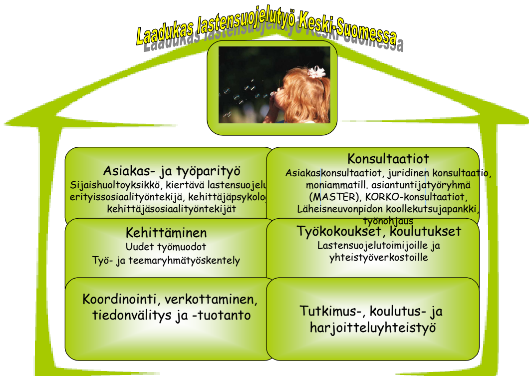
Kuvio 2. Keski-Suomen lastensuojelun kehittämisyksikön toimintamuodot.

nallisesti ja alueellisesti tuotettua lastensuojelutietoa ja kehittämistyön tuloksia ja välitti niitä suunnitelmallisesti maakuntaan. Kehittämisyksikkö myös kehitti uusia ja jo olemassa olevia asiakastyön muotoja, organisoivat vertaistukea oman sektorin henkilöstölle (ks. Lähteinen 2006) ja verkotti toimijoita koulutusten ja työkokousten avulla (liite 1.). Kehittämisyksikössä luotiin pysyviä konsultaatiotoiminnan muotoja, kuten KORKO-konsultaatiot, työnohjaajalistat, läheisneuvonpidon koollekutsujapankki ja moniammatillinen lastensuojelun asiantuntijatyöryhmämalli, joiden toiminnan jatkuvuuden kannalta kehittämisyksikkörakenteen vakinaistaminen olisi ollut ensisijaisen tärkeää. Kehittämisyksikön kokonaisuus ja toimintamuodot on koottu kuvioon 2.