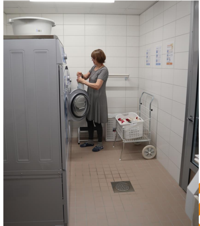
Laukaan Ilonan pesutupa