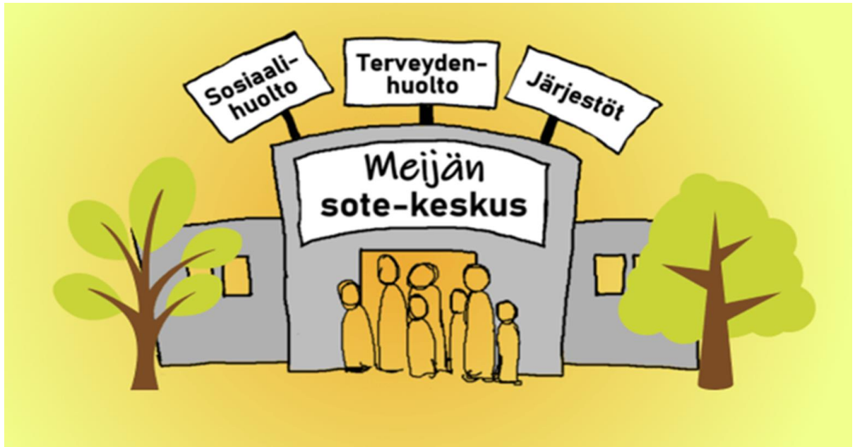
Kuva 2. Meijän sote-keskus