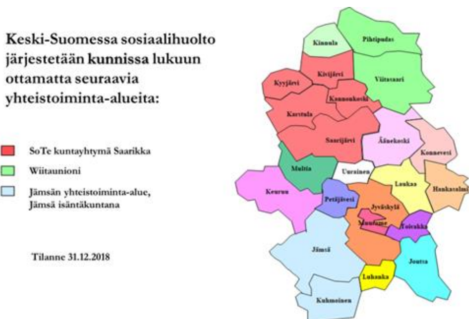
Kuva 2. Sosiaalihuollon järjestäminen Keski-Suomessa

Työskentely kuntapohjalta aluepohjalle siirtymiseksi on joka tapauksessa edessä, tuleepa hallituspohjaksi mikä tahansa ja eteneepä sote-uudistus miltä pohjalta tahansa. Keski-Suomessa toimitaan edelleen pääasiassa kuntapohjalla (kuva 2). Kosken tehtäväksi asettuu omalta osaltaan jatkossa sekä kuntien sosiaalihuollon toiminnan yhteensovittaminen uudessa sote-rakenteessa että sote-maakunta-kuntarakenteen hyvinvoinnin edistämistyö. Kosken tulee myös jatkaa sosiaalihuollon itsetutkiskelua ja tukea alan toimijoita mm. sosiaalihuoltolain toimeenpanossa edelleen .