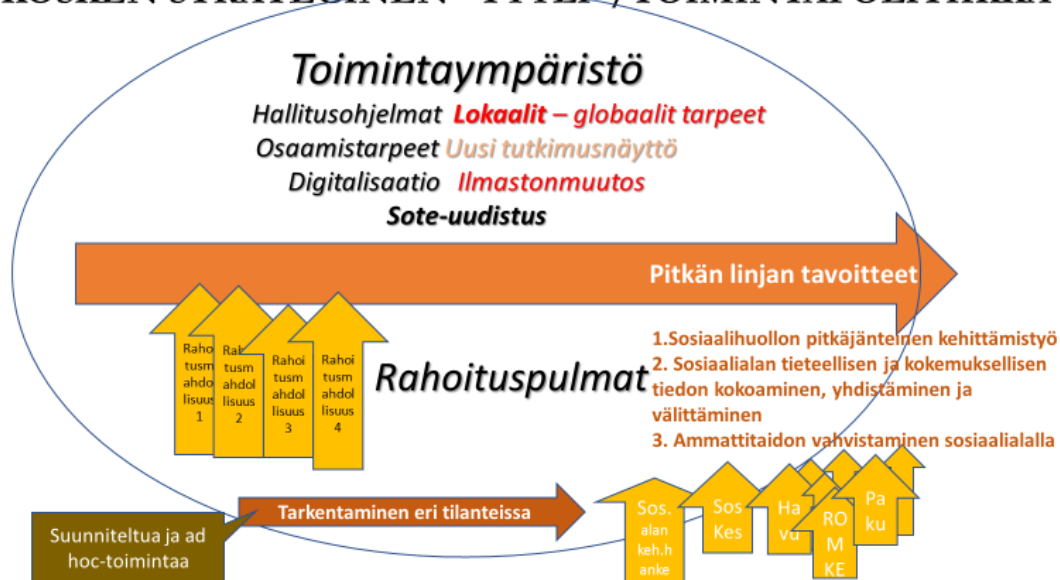
Kuva 1. Kosken toimintapolitiikka

Näistä erilaisista haasteista huolimatta Koske on vuodesta toiseen sitkeästi toteuttanut perustehtävänsä: ”Keski-Suomen sosiaalialan osaamiskeskus